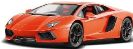
Машина из железа, какая? железная