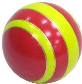
Мяч из резины, какой? резиновый