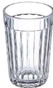
Стакан из стекла, какой? стеклянный