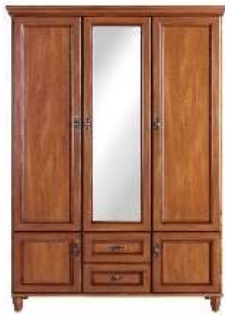
Шкаф из дерева, какой? деревянный

Инструкция: послушай внимательно, как я скажу «Кораблик из бумаги – бумажный», а как скажешь ты?