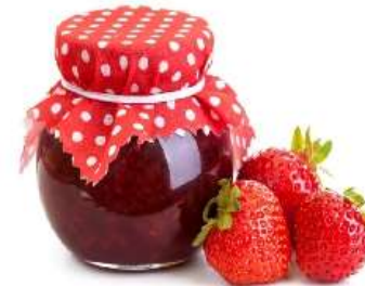
Варенье из клубники, какое? клубничное