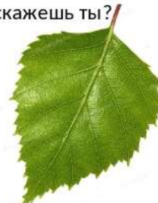
Лист из березы, какой? березовый