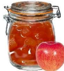
Варенье из яблок, какое? яблочное