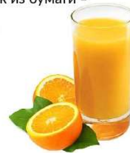
Сок апельсина, какой? апельсиновый