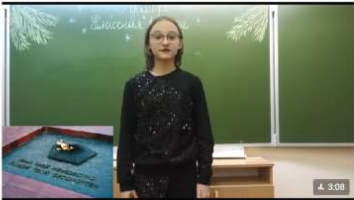
Видео от МБОУ г.Мурманска СОШ №50 92 просмотра

МБОУ г.Мурманска СОШ №50 час назад «Нельзя научиться любить живых, если не умеешь хранить память о павших». К.К. Рохоссовский #навигаторыдетства #навигаторыдетства51 #Росдетцентр #РДШ #РДДМ #памятинеизвестного